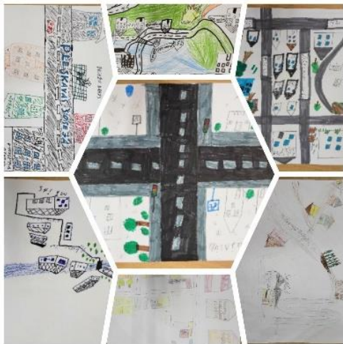
Zīmējam plānu/shēmu-“Mans ceļš uz skolu”