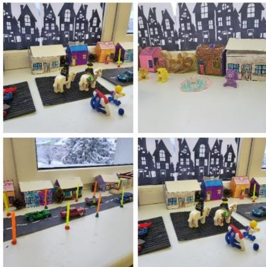
Projektējam, būvējam pilsētu.