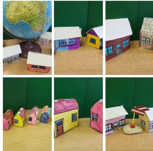
Veidojam māju 3D modeļus.